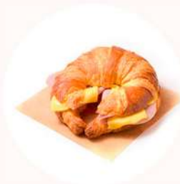
CROISSANT SALADO 4,5€