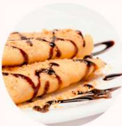
CREPPES 4,0€ chocolate, dulce de leche o fresas con nata