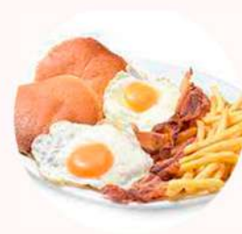
BRUNCH 7,0€ AMERICANO