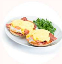
HUEVOS 5,0€ BENEDICT