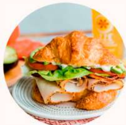
CROISSANT VEGETAL 4,5€